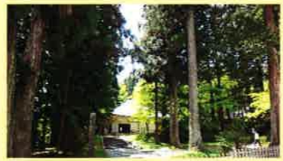
● 平泉 ● 一関市の隆寺村社園遺跡も関連した平泉の世界遺産。浄土思想による寺院・庭園が多く残る。