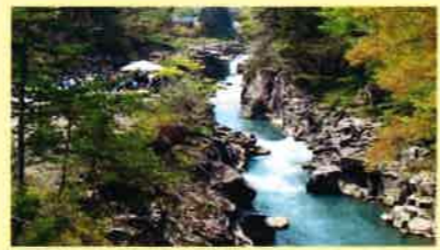
● 藤巻溪 ● 釜井川の浸食で形成されたダイナミックな景観が2kmにわたって続く。