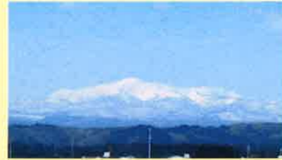
● 栗駒山 ● 標高 1827m 一関では須川岳と呼ばれている。特に紅葉の季節は絶景。

一関市は岩手県最南端、仙台市と盛岡市の中間地点、東北地方のほぼ中央に位置している。東京から450kmで新幹線や高速自動車道などのアクセスも整っている。平泉の世界遺産にも近く、周辺には自然が生み出した絶景も多数ある。