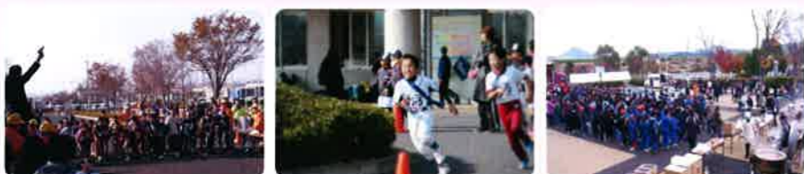
毎年好評のトン汁とお楽しみ抽選会も開催しています。