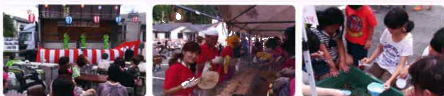
地域の皆様と一緒に楽しいひとときを…